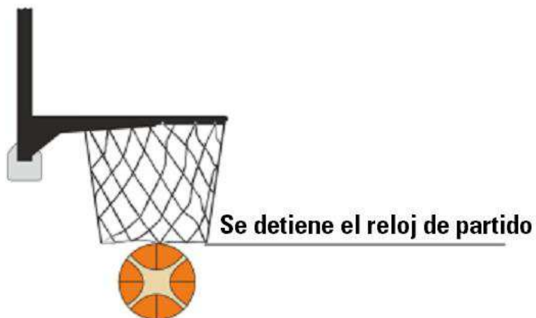
Diagrama 2. Tiro convertido

el reloj de partido se detendrá cuando el balón permanezca o haya atravesado completamente el cesto, tal como se muestra en el Diagrama 2.