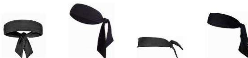
Diagrama 1. Ejemplos de cintas para el pelo tipo bufanda

4-4 Afirmación: No se permite llevar cintas para el pelo tipo bufanda.