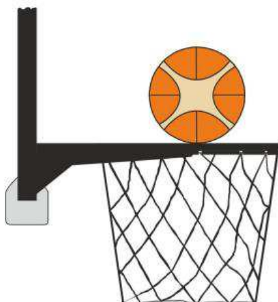
Diagrama 3 Balón en contacto con el aro

31-18 Afirmación: Es una violación de interferencia si un defensor o un atacante, durante un tiro, toca la canasta (aro o red) o el tablero mientras el balón está en contacto con el aro y aún tiene posibilidad de entrar en la canasta.