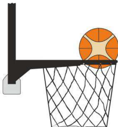
Diagrama 4 Balón dentro de la canasta

31-23 Afirmación: Es una violación de interferencia si un defensor toca el balón mientras el balón está dentro de la canasta.